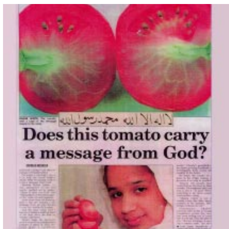
Tomate conteniendo mensajes sagrados musulmanes, Huddersfield, Reino Unido, 1997