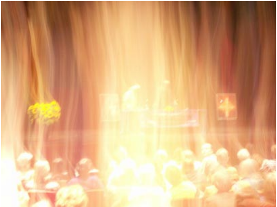
Energía dorada inunda la sala de conferencias en Ámsterdam, Holanda, el 20 de septiembre de 2006 mientras Benjamin Creme es adumbrado por Maitreya.