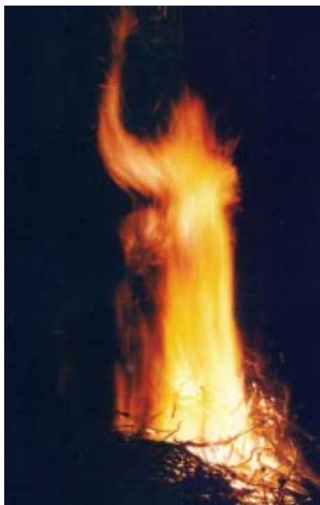
Figura aparece en las llamas de una hoguera, Lascekl, Slovenia, 2002