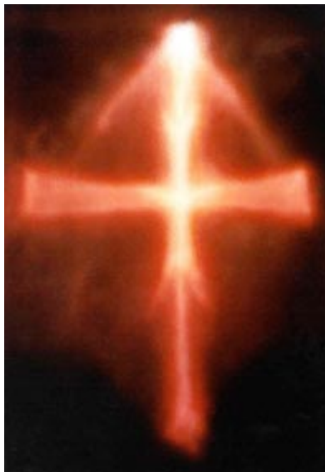
Una cruz de luz en Eslovenia, manifestada por Maitreya