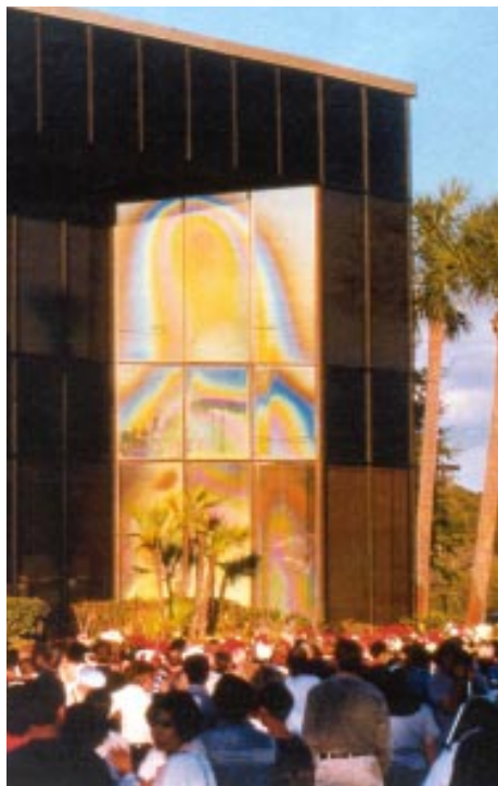
Imagen de la Virgen en las ventanas de un banco, Clearwater, Florida, EEUU, 1996

Finalmente se descubrirá una red mundial de 777 fuentes de agua milagrosa, en una secuencia que será determinada por Maitreya. Las aguas ayudarán a curar las muchas dolencias de la humanidad, estimulará el sistema inmune, y purificará el cuerpo físico. En 1993 el agua de Tlacote se utilizó para hacer remedios homeopáticos de los cuales ahora se benefician miles de personas en todo el mundo. El agua de la gruta de Nordenau también fue convertida en remedio homeopático.