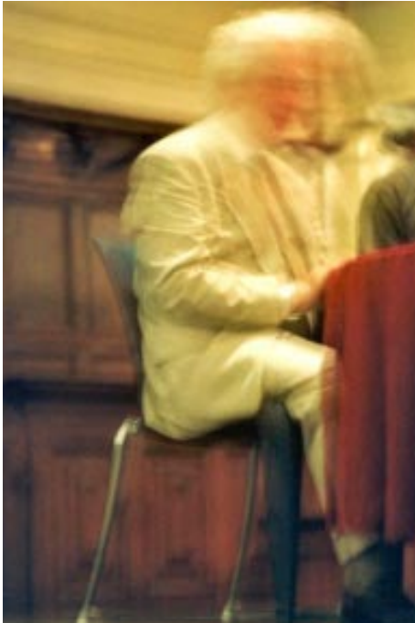
Adumbramiento de Benjamin Creme por Maitreya en su conferencia en Ámsterdam, Holanda, el 26 de septiembre de 2001.

ostentan su riqueza ante los pobres; cuando cada hombre es el enemigo de su vecino; cuando ningún hombre confía en su hermano?