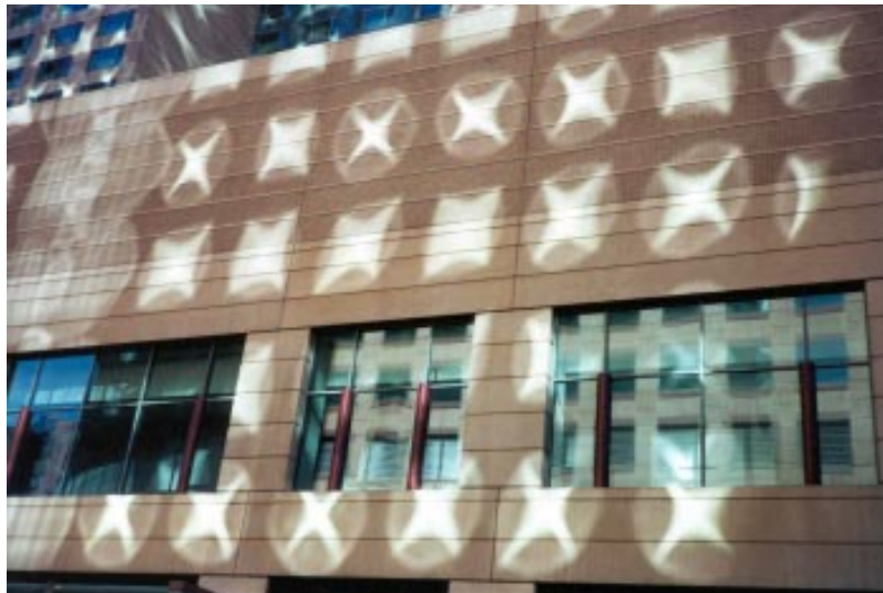
Círculos de luz en un hotel de Denver, Colorado, EEUU, manifestados por Maitreya. Foto hecha en Noviembre de 2000.