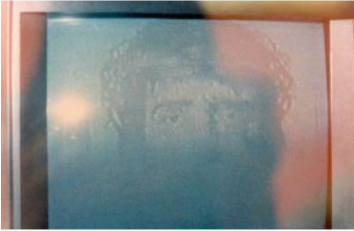
Imagen de Cristo con corona de espinas materializada en una foto de una pantalla de televisor apagada después de que un hombre local bebiera y se curara con agua de un manantial en Tlacote, México. El agua ha sido 'magnetizada' por Maitreya antes de Su aparición en Ciudad de México el 29 de Septiembre de 1991.

En esa Conferencia Maitreya pidió al Rey Hussein de Jordania si él renunciaría a la soberanía de Cisjordania para proporcionar una patria para el pueblo palestino.