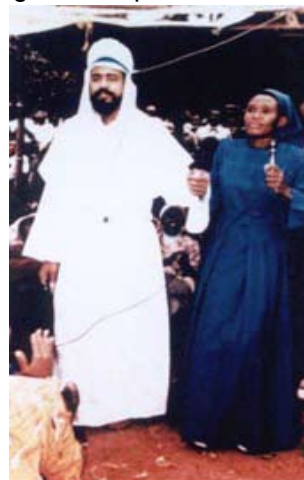
Maitreya, como se apareció ante 6.000 personas en Nairobi, Kenia, 11 junio 1988

a fundar una nueva religión sino que viene como un educador en el sentido más amplio de la palabra. Él buscará inspirar a la humanidad para que se considere como una sola familia, y crear una civilización basada en el compartir, la justicia económica y social, y la cooperación global.