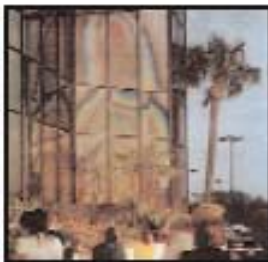
Imagen de la Virgen en las ventanas de un banco, Clearwater, Florida, EEUU, 1996