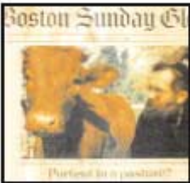
significa la venida del Mesías, Israel, 1996