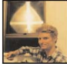
Izquierda: Cruz de luz, Auckland, Nueva Zelanda, 1997 Derecha: Imagen de Jesús en una roca, este de Perth, Australia, 1995