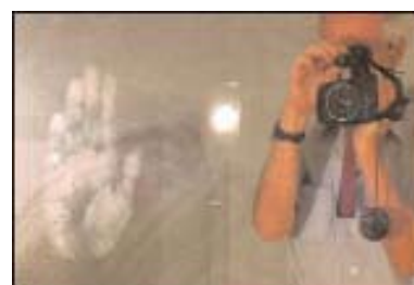
Foto: El Sr. Londner fotografiando la huella de la mano de Maitreya en el espejo del lavabo familiar

Noticias de milagros de personas que han pedido ayuda de la ‘mano’ se publican regularmente en la revista Share International .