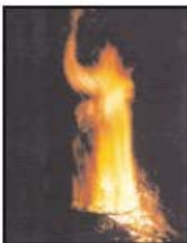
Figura aparece en las llamas de una hoguera, Lascek, Eslovenia, 2002