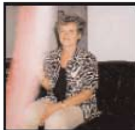
Izquierda: Bendición de luz en una foto, Holanda, 1998 Derecha: Estatua de la Virgen que llora, County Wicklow, Irlanda, 1994