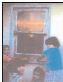
Izquierda: Cruz de luz, El Monte, California, EEUU, 1998 Derecha: Cruz de luz, Los Angeles, EEUU