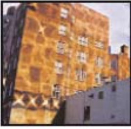
Patrones de luz, Edmonton, Alberta, Canadá, 2001 Icono de Jesús