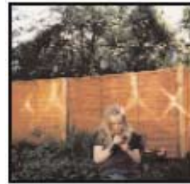
Izquierda: Patrones de luz, Hove, Reino Unido, 2002 Derecha: Bendición de luz en una foto, York, Reino Unido, 1994