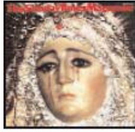
Izquierda: Estatua de la Virgen derrama lágrimas de sangre, México, 1992 Derecha: Tomate contiene mensajes sagrados musulmanes, Huddersfield, Reino Unido, 1997